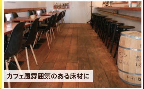
カフェ風雰囲気のある床材に