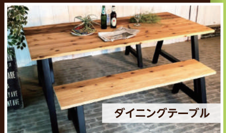
ダイニングテーブル