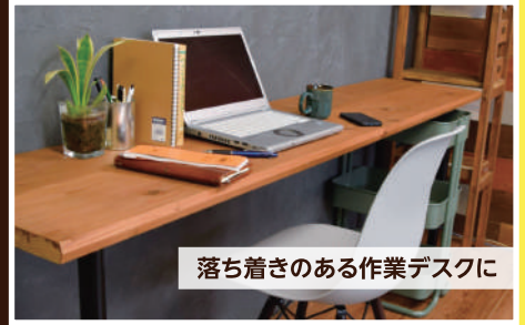
落ち着いたある作業デスクに